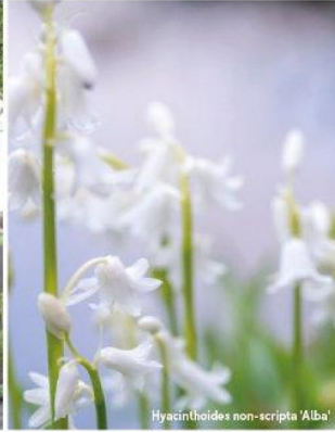
Hyacinthoides non-scripta 'Alba'

In februari begint het bollenfeest al met de bloei van sneeuwklolkjes ( Galanthus nivalis ), narcissen ( Narcissus ), sterhyacinten ( Scilla ), boshyacinten ( Hyacinthoides non-scripta ) en oosterse anemonen ( Anemone blanda ), alle verwideringsbollen. Alie: "Het tuinjaar start voor mij met bloembollen in combinatie met het prille blad van vaste planten en vroege bloeiers als tranend hartje ( Dicentra ), vergeet-mij-nietjes ( Myosotis ), judaspenning ( Lunaria ) en muurbloem ( Erysimum ). Half mei, wanneer het bollenfeest voorbij is, ga ik direct aan de slag met voorgezaaide eenjarige en voortgetrokken zomerbollen. Er is dan nog een beetje ruimte voordat de vaste planten als kool beginnen te groeien en bloeien. Ik gebruik daarvoor rijkbloeiende, friskleurige eenjarige als cosmea ( Cosmos bipinnatus ), kattensnor ( Cleome ), wasbloem ( Cerinth ), ijzerhard ( Verbena bonariensis ), bolpapaver ( Papaver somniferum ) en juffertje-in-het-groen ( Nigella ) als 'strooigoed' tussen de vaste planten."