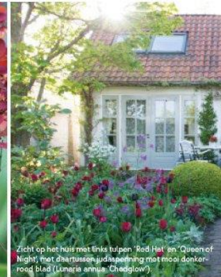
Zicht op het huis met links tulpen 'Red Hat' en 'Queen of Night' met dachtussen ijdapeening met mooi donkerrood blad (Lunaria annua 'Chedglow').

plant ze met een bollenplanter met een lange steel, die duw je gemakkelijk rechtstaand in de grond dankzij die steel. Dat is een verademing voor mijn rug, dan hoef ik niet op mijn knieën duizenden kultjes te graven, want op een middag plant ik wel achthonderd bollen! En daarbij kijk ik heus niet bij elke bol of deze met zijn neus naar boven ligt, die bol weet heus wel waar-ie wezen moet, naar het licht toe! Gaat het een keer mis, dan valt dat niet op in deze tuin die zo vol staat. Alleen wanneer ik een keizerskroon (Fritillaria persica) in de grond zet, let ik wel op. Deze poot ik altijd schuin zodat er geen water in de bol komt, dan zou hij verrotten." Alië durft de bollen ook midden in een pol van een vaste plant te potten. "Bij ooeivaarsbek (Geranium phaeum) en kattenkruid (Nepeta) gaat dat goed. Ik steek dwars door de wortels heen, plaats de bol en zet daarna de uitgestoken wortels weer in het gat."