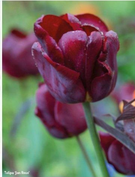
Tulipa 'Jan Reus'