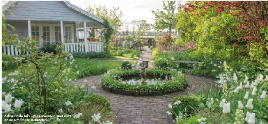
Achter in de tuin ligt de moestuin, met zicht op de Groningse weilanden.