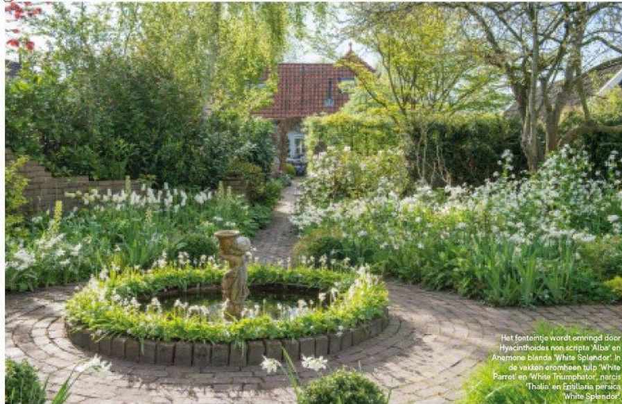
Het fonteinje wordt omringd door Hyacinthoides non-scripta 'Alba' en Anemone blanda 'White Splendor'. In de midden erambesen tulp 'White Parrot' en 'White Triumphator', narcis 'Thalia' en Fritillaria persica 'White Splendor'.