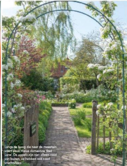
Langs de boog die naar de moestuin voert staat Malus domestica 'Red Lane'. De appels zijn niet alleen rood van buiten, ze hebben ook rood vruchtvlies.