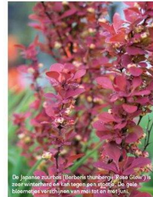
De Japanse zaarboos (Berberis thunbergii 'Rose Glow') is zeer winterhard en kan tegen een stootje. De gele bloemtypes verschijnen van mei tot en met juni.