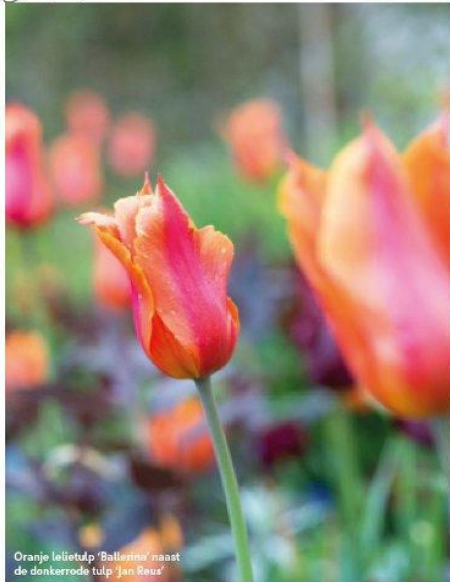
Oranje lelietulp 'Ballarina' naast de donkerrode tulp 'Jan Reus'