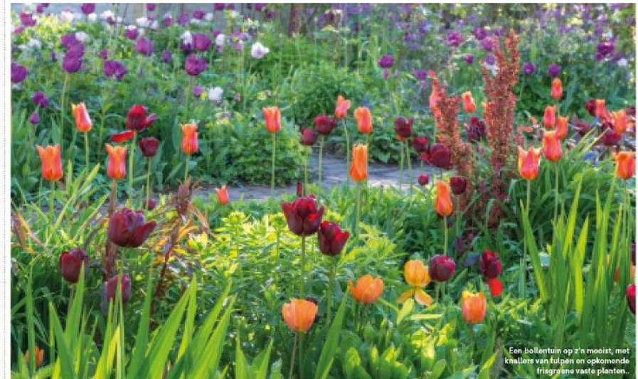
Een bollentuin op z'n mooist, met knallers van tulpen en opkomende friegroene vaste planten...

Voorjaarsbollen geven de tuin kleur na een lange kale winter. Ze zijn bovendien goedkoop en verkrijgbaar in een reeks prachtige variëteiten. In deze beplantingsgids staat alles wat je moet weten om bollen te planten, zodat je de hele lente van prachtige bloemen kunt genieten.