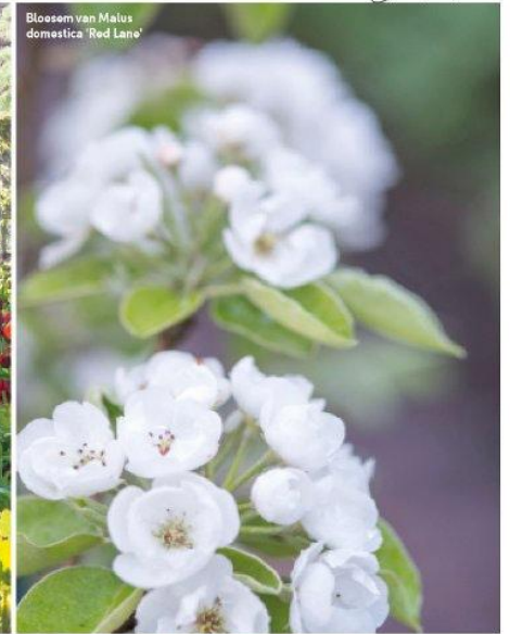
Bloesem van Malus domestica 'Red Lane'