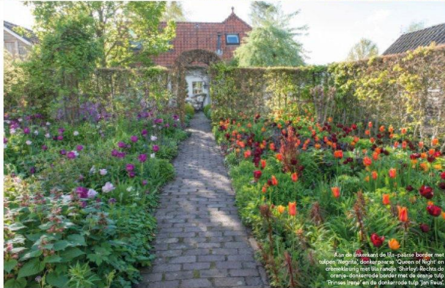
Aan de linkerkant de lila-paarse border met tulpen 'Negrita', donkerpaarse 'Queen of Night' en oranjeleuning met lila randje 'Shirley'. Rechts de oranje-donkerrode border met de oranje tulp 'Prinses Irene' en de donkerrode tulp 'Jan Reus'.