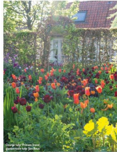
Oranje tulp 'Prinses Irene', donkerrode tulp 'Jan Reus'

De tuin is van februari tot en met eind oktober nooit leeg. Pas daarna komt het werk van knippen, scheuren, herplanten en vooral het bollen planten. Alie doet dat niet in een keer want: "Er gaan dan wel duizenden bollen in. Niet allemaal tegelijk, gelukkig kun je dat spreiden. Vroegbloeiende bollen plant ik zo snel mogelijk na aankoop. Tulpen kunnen het best in november geplant worden. Het zijn 'koele kikkers' die van koude grond houden, in warme grond zijn ze vatbaar voor schimmelziekten. Ik