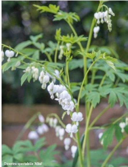
Dicentra spectabilis 'Alba'