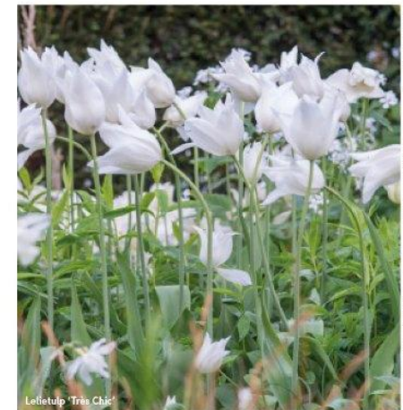
Lelietulip 'Tris Chic'

Hoewel je ze in de herfst bij tuincentra kunt kopen, zijn er ook veel plaatsen waar je ze online kunt bestellen. Kijk vooral eens bij zelfstandige kwekers. Sommige kwekers zijn gespecialiseerd in bepaalde soorten.