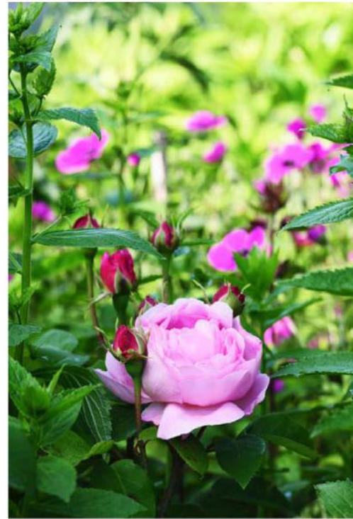
Detail van Rosa 'Constance Spry', met op de achtergrond geranium psilostemon.

Wat ooit gold als de slechtste grond van het dorp, is nu een van de mooiste tuinen van de omgeving! Rondom haar huis heeft Alie een fantastische bezoektuin aangelegd, met verschillende borders op kleur.