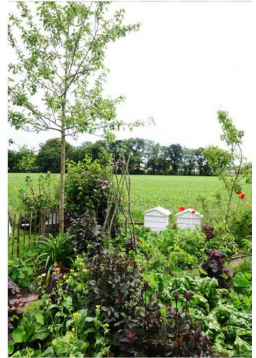
De moestuin met fruitboompjes, snijbiet, dahlia's en bijenkasten. De moestuin is op kleur geplant.

tuin?" Een tuinontwerp maken voor een klant gaat veel verder dan even een schetsje maken en wat bloemen en planten intekenen. Ik verplaatst me in de klant, luister naar wat ze willen. Ik daag ze uit, neem ze mee in het proces en laat ze zien dat je ook zonder intensief onderhoud een hele fijne, volle tuin kunt laten ontstaan."