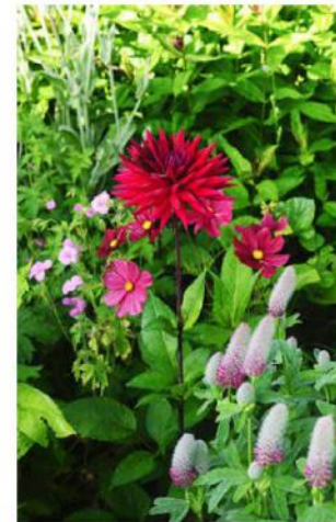
De Dahlia 'Black Wizard' is een prachtige bloem om te combineren. Hier zien we ze samen met Cosmos 'Rubenza' en Trifolium rubens.