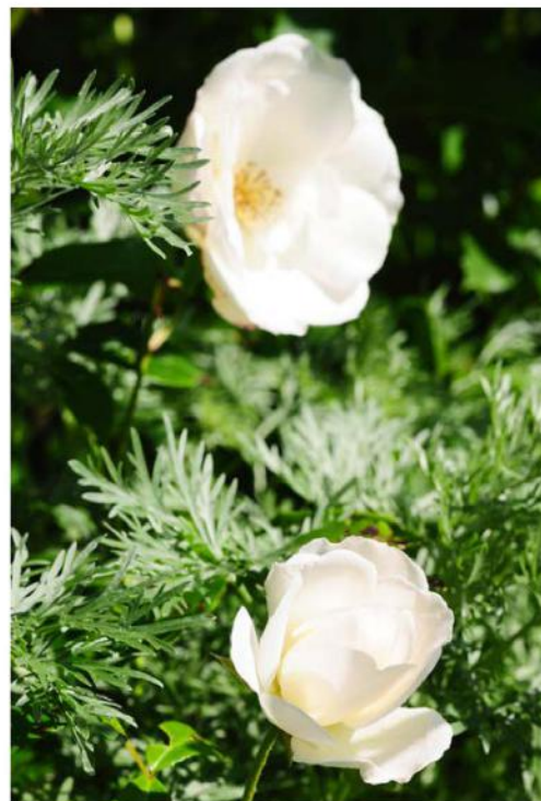
Rosa "Schneewitchen" en Artemisia "Powis Castle". Alle heeft ze zo bij elkaar geplaatst omdat ze rozen kaal in zwarte aarde maar niks vindt. Het grijze loof is als het ware de onderbegroeiing voor de bloemen.