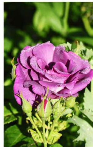
De Rosa 'Rhapsody in Blue' is een goede doorbloeiende heesterroos, ook op zandgrond.