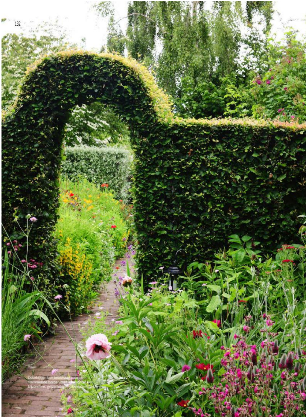
Doorkijkje door beek naar de vlammende border, met de achter een bijzondere, grijze haag.

“Ik werk uitsluitend met bijzondere planten die op sterkte zijn getest”