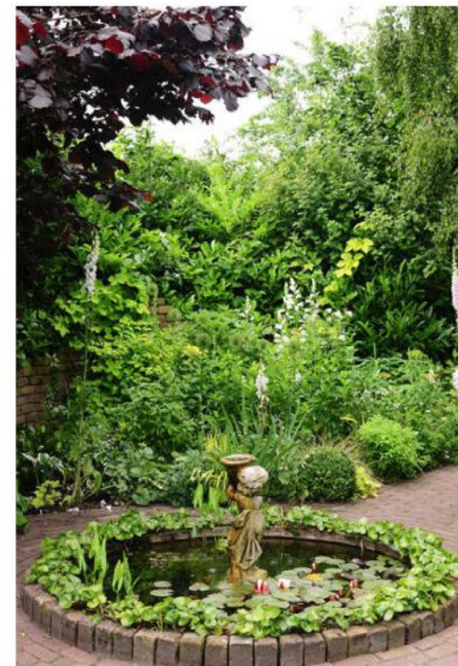
De wit-grijze border met op de voorgrond de vijver. In de randbeplanting staat Asarum europaeum met daarin heel veel voorjaarsbolletjes.