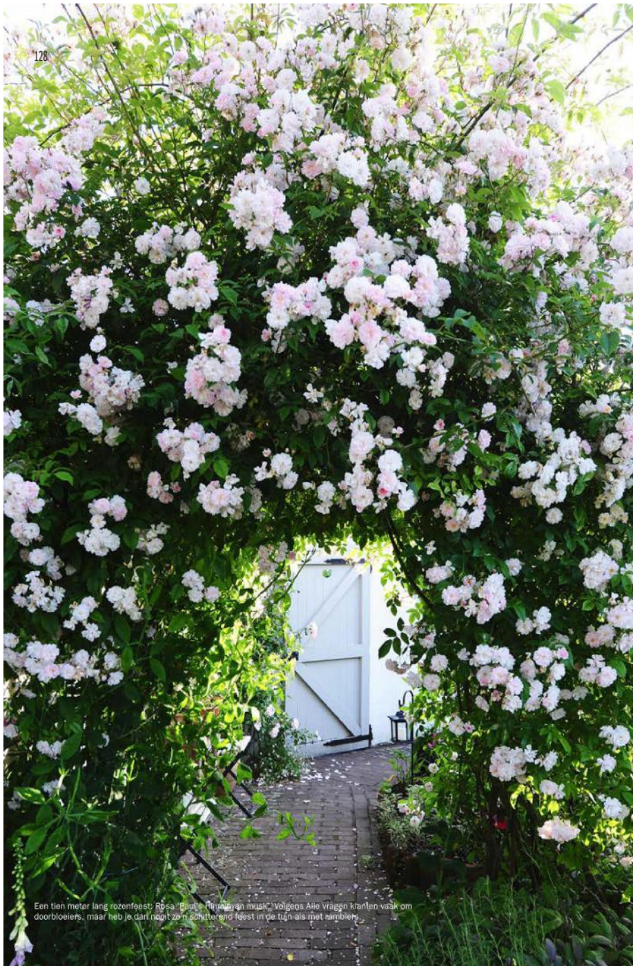
Een tien meter lang rozenfeest: Rosa 'Paul's Himalayan Musk'. Volgens Alle vragen klanten vaak om doorbloeiers, maar heb je dat nogt zo'n schitterend feest in de tuin als met ramblers.

“In mijn tuin hebben planten de hoofdrol, zij bepalen de sfeer” Alle Stoffers