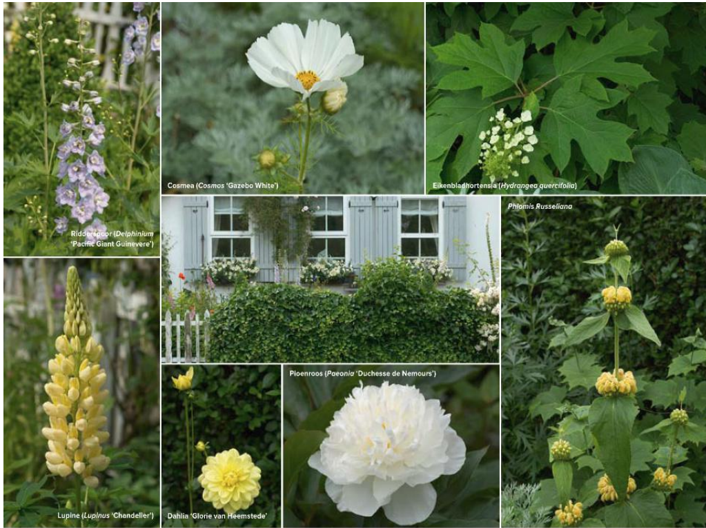
Cosmea (Cosmos 'Gazebo White')